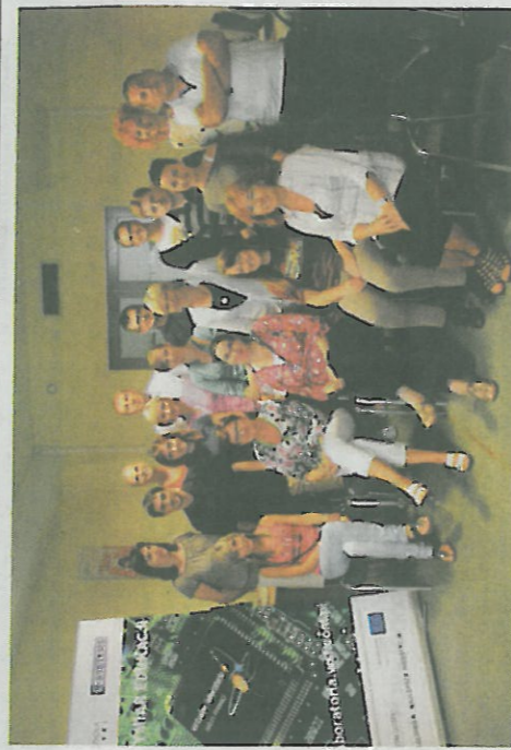
Grupa nauczycieli z Wielkopolski na szkoleniu w Poznaniu - Wyższa Szkoła Logistyki, 27-29.08.2012r.

UNIA EUROPEJSKA EUROPEJSKI FUNDUSZ SPOŁECZNY